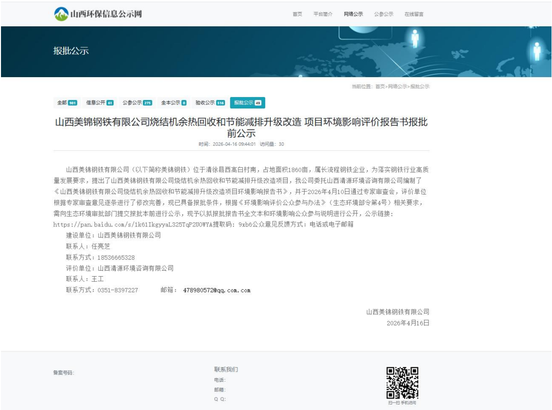
图 4-1 报批前全文本公示截图

烧结机余热回收和节能减排升级改造项目环境影响评价报告书进行报批前公示，公示网址： https://www.sxhb.top/?bpgs/984.html ，公示截图如下：