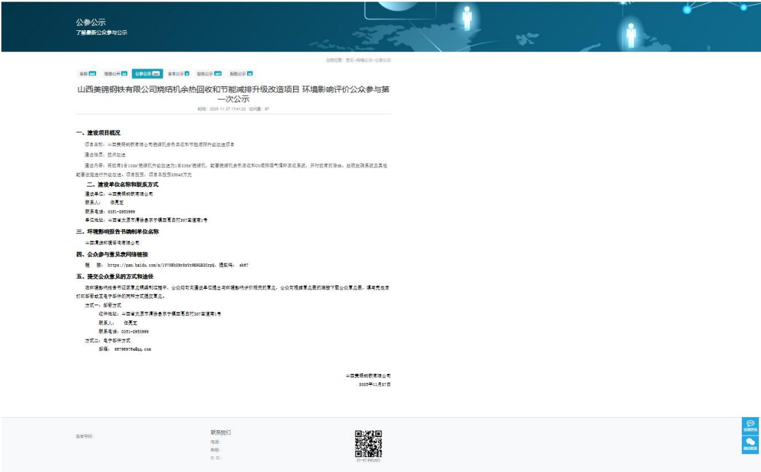
图 2-1 一次网络公示截图

山西美锦钢铁有限公司于 2025 年 11 月 20 正式委托山西清源环境咨询有限公司承担本项目的环评评价，建设单位根据《环境影响评价公众参与办法》（生态环境部令第4号）于 2025 年 11 月 27 日进行了第一次公示。在山西环保信息公示网进行了公示，公示网址为 https://www.sxhb.top/?gcgs/912.html ，公示主要内容见图 2-1：