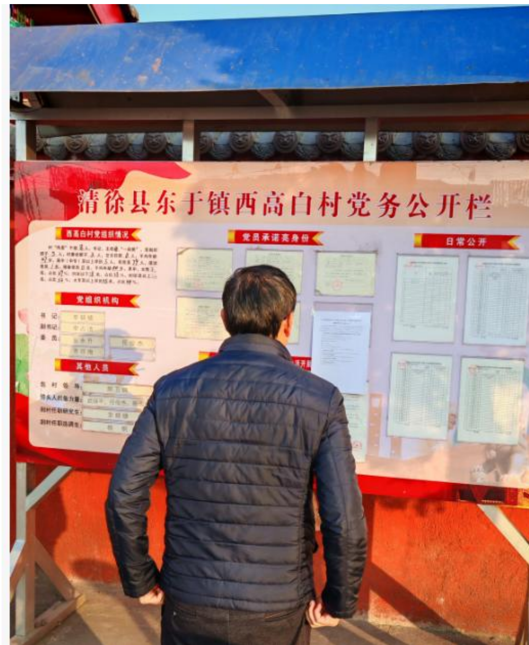
西高白村现场公示照片

张贴公示主要在项目建设及运营可能受影响的西高白、夏家营等村庄人流较大的地方进行公示符合要求。粘贴时间为 2026 年 1 月 19 日~2026 年 1 月 30 日。现场张贴公示照片如下图所示：